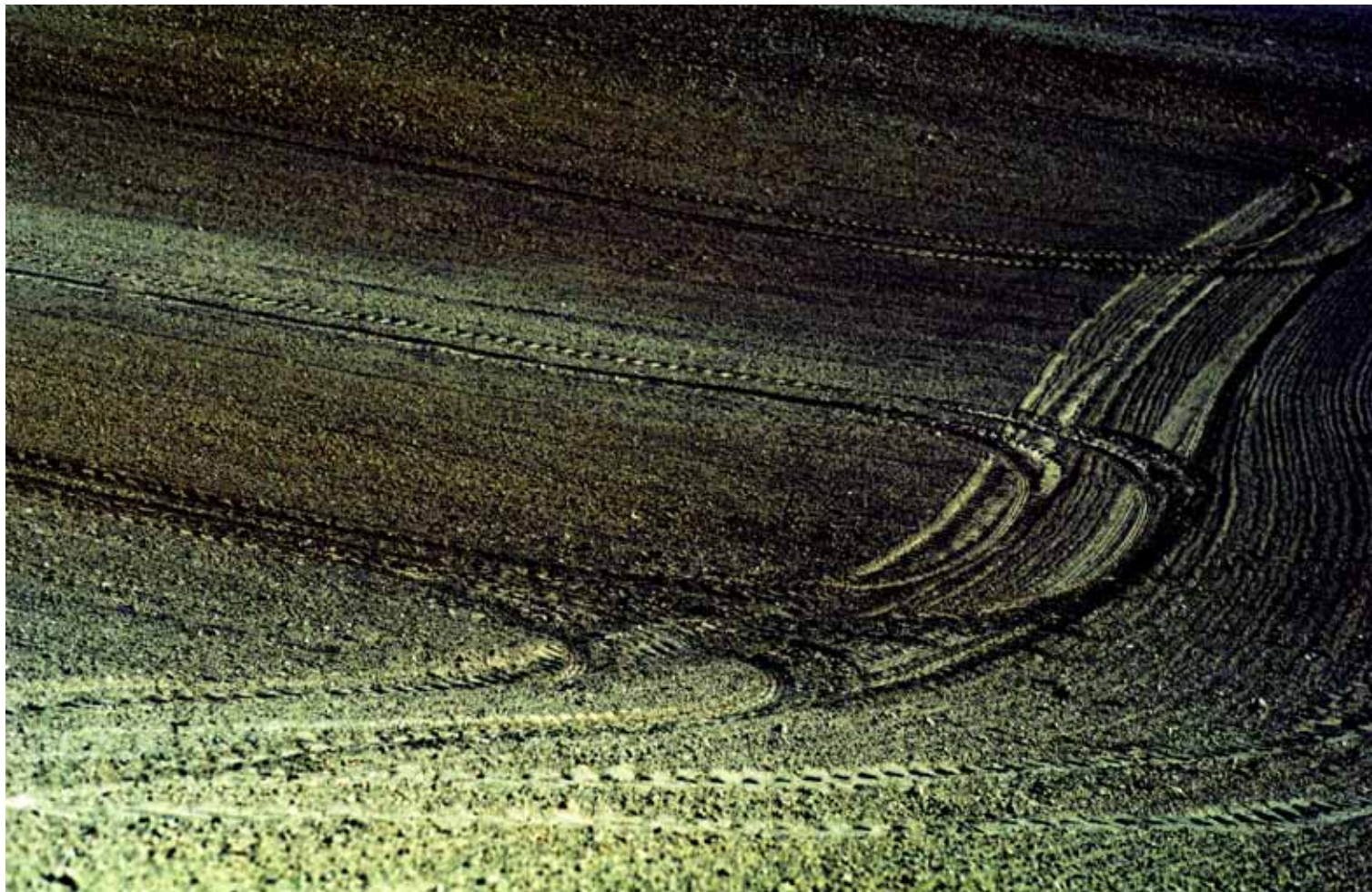
Z cyklu Kompozycje: XII, 2009