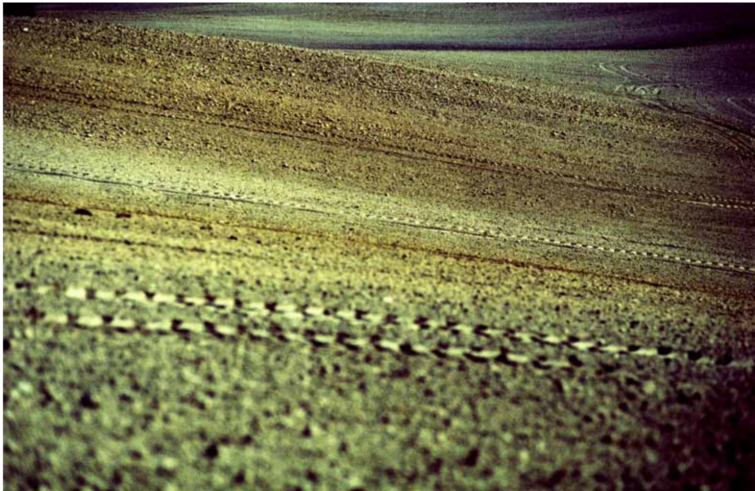
Z cyklu Kompozycje: III, 2009