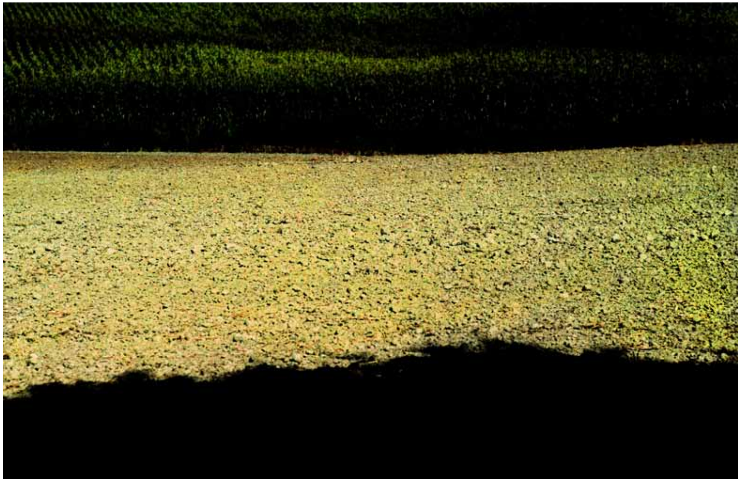
Z cyklu Kompozycje: XLI, 2009