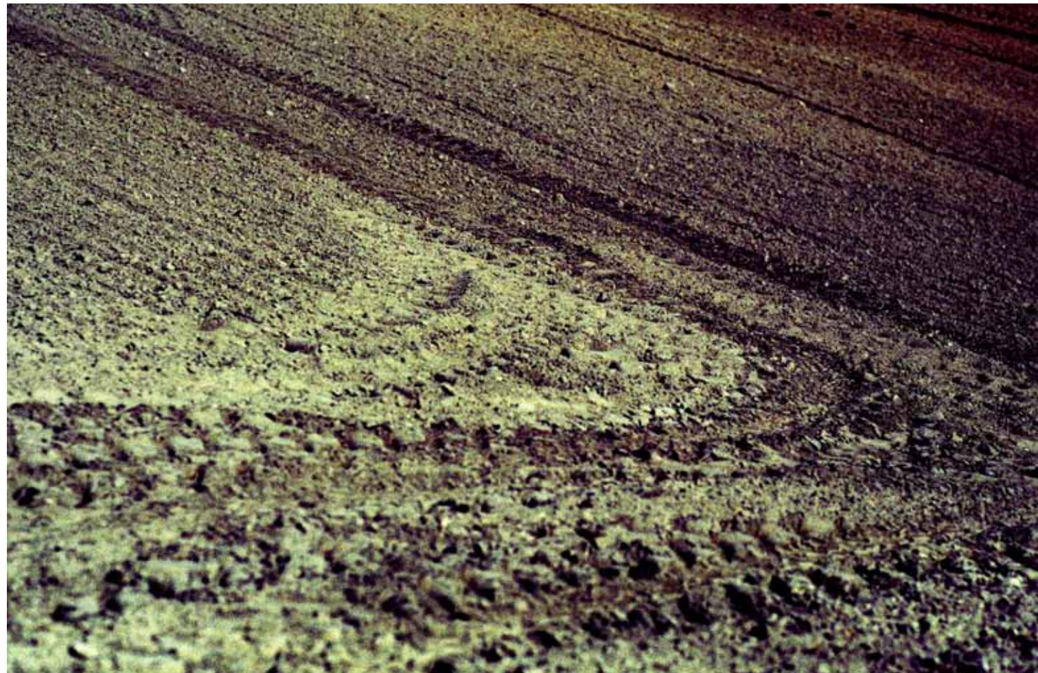
Z cyklu Kompozycje: X, 2009