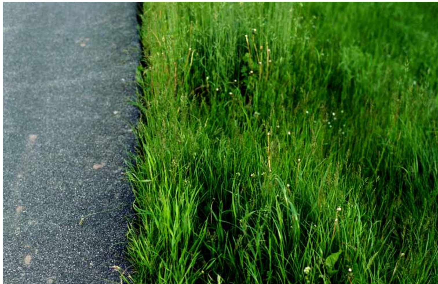
Z cyklu Droga: 44, 2010