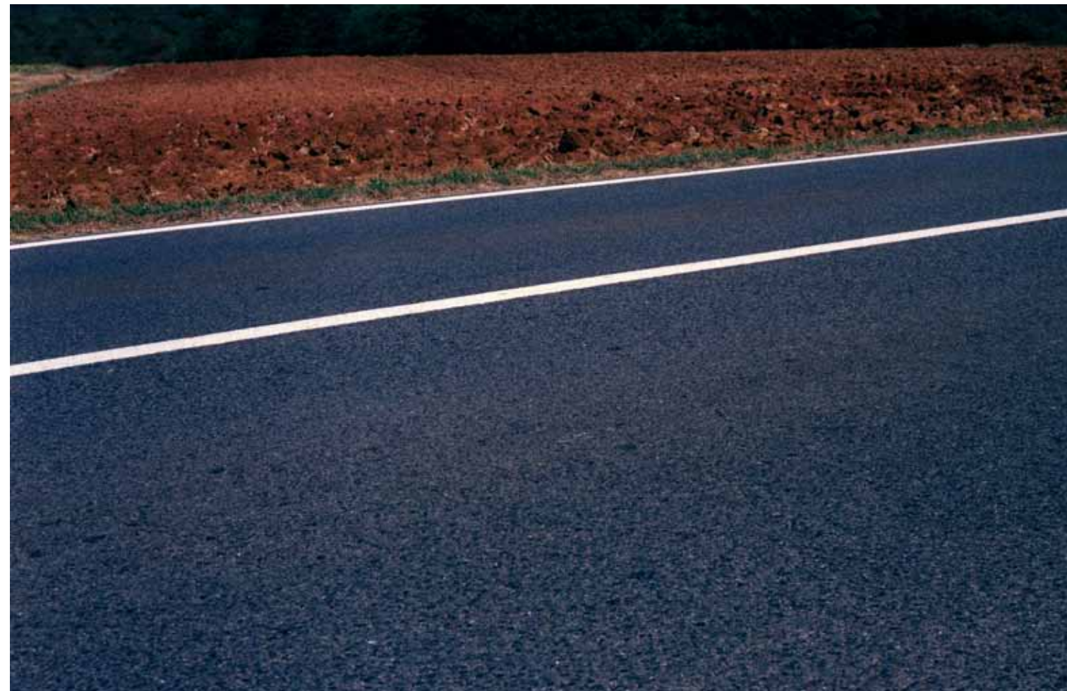
Z cyklu Droga: 17, 2009