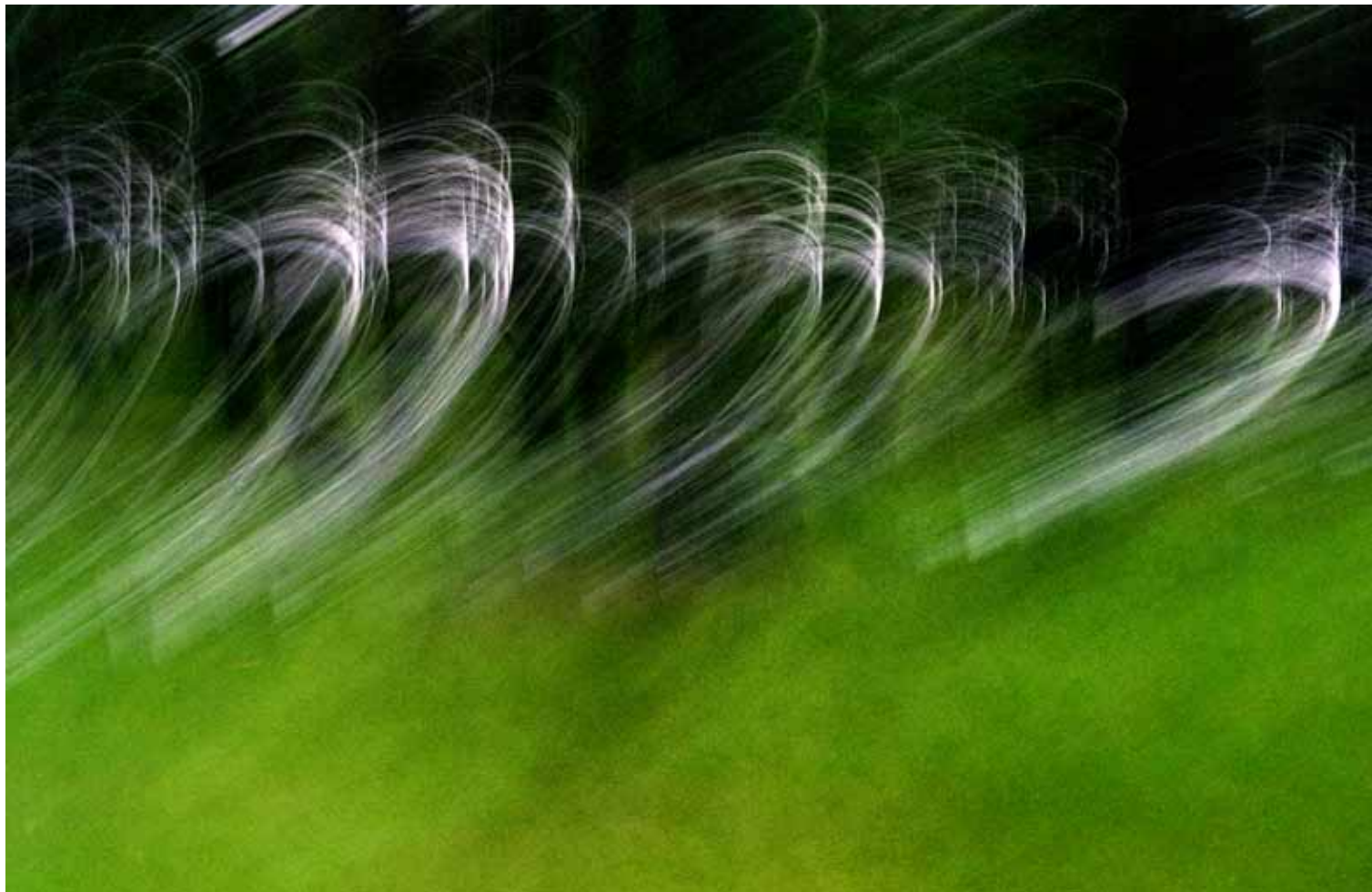
Z cyklu Pejzaże dynamiczne: Pejzaż 100, 2008