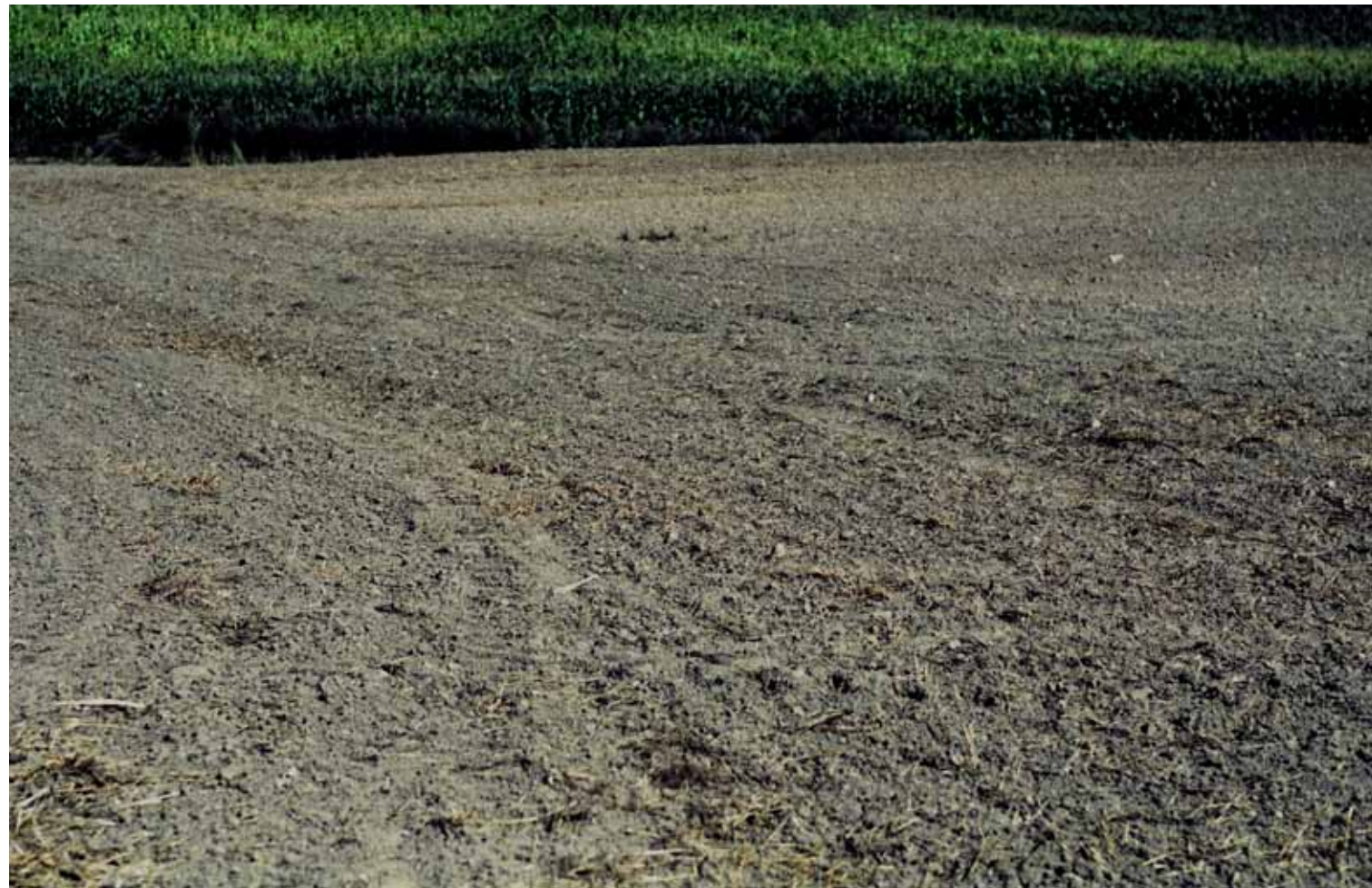
Z cyklu Kompozycje: XXI, 2009