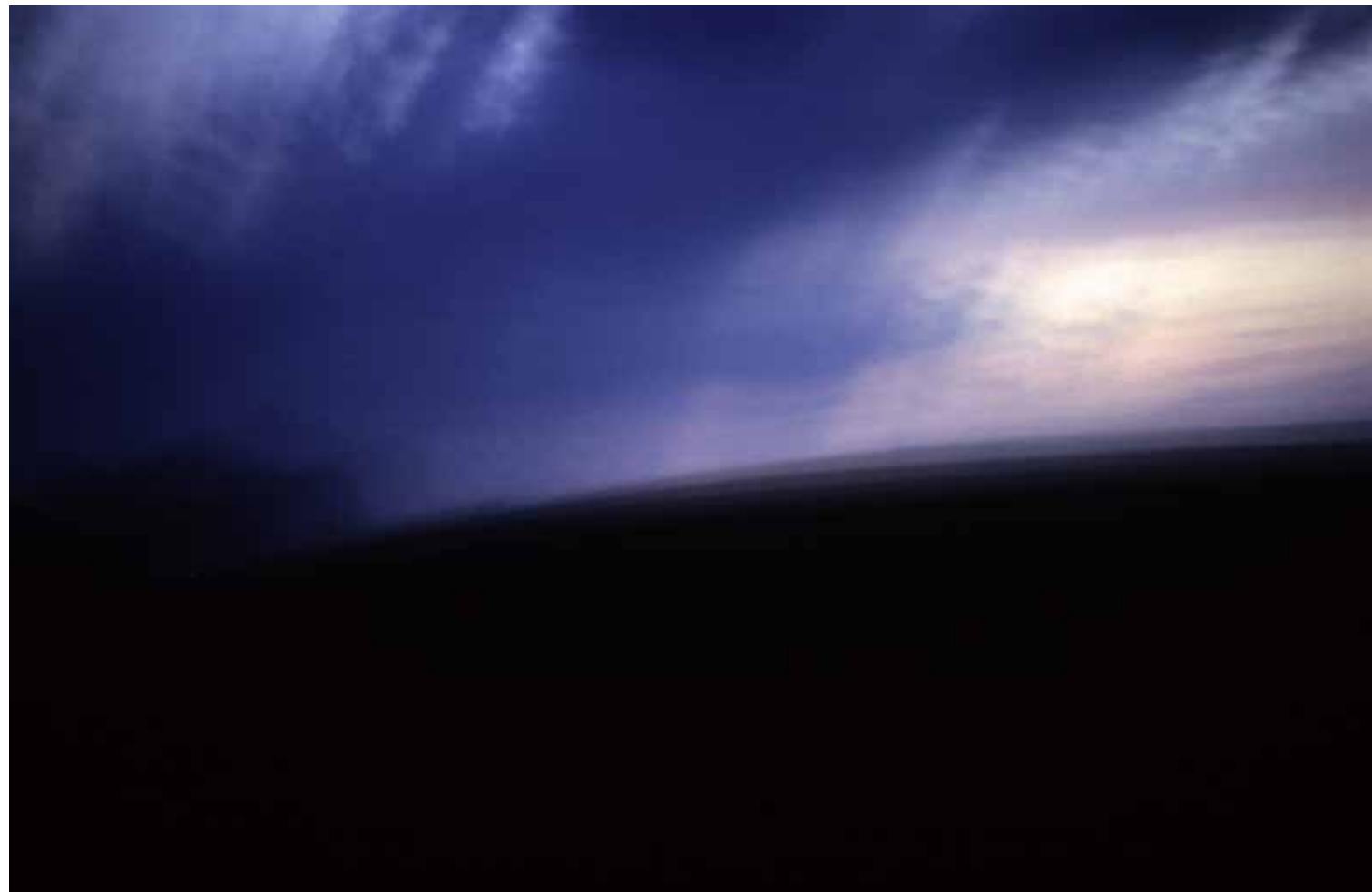
Z cyklu Pejzaże dynamiczne: Pejzaż 58, 2007