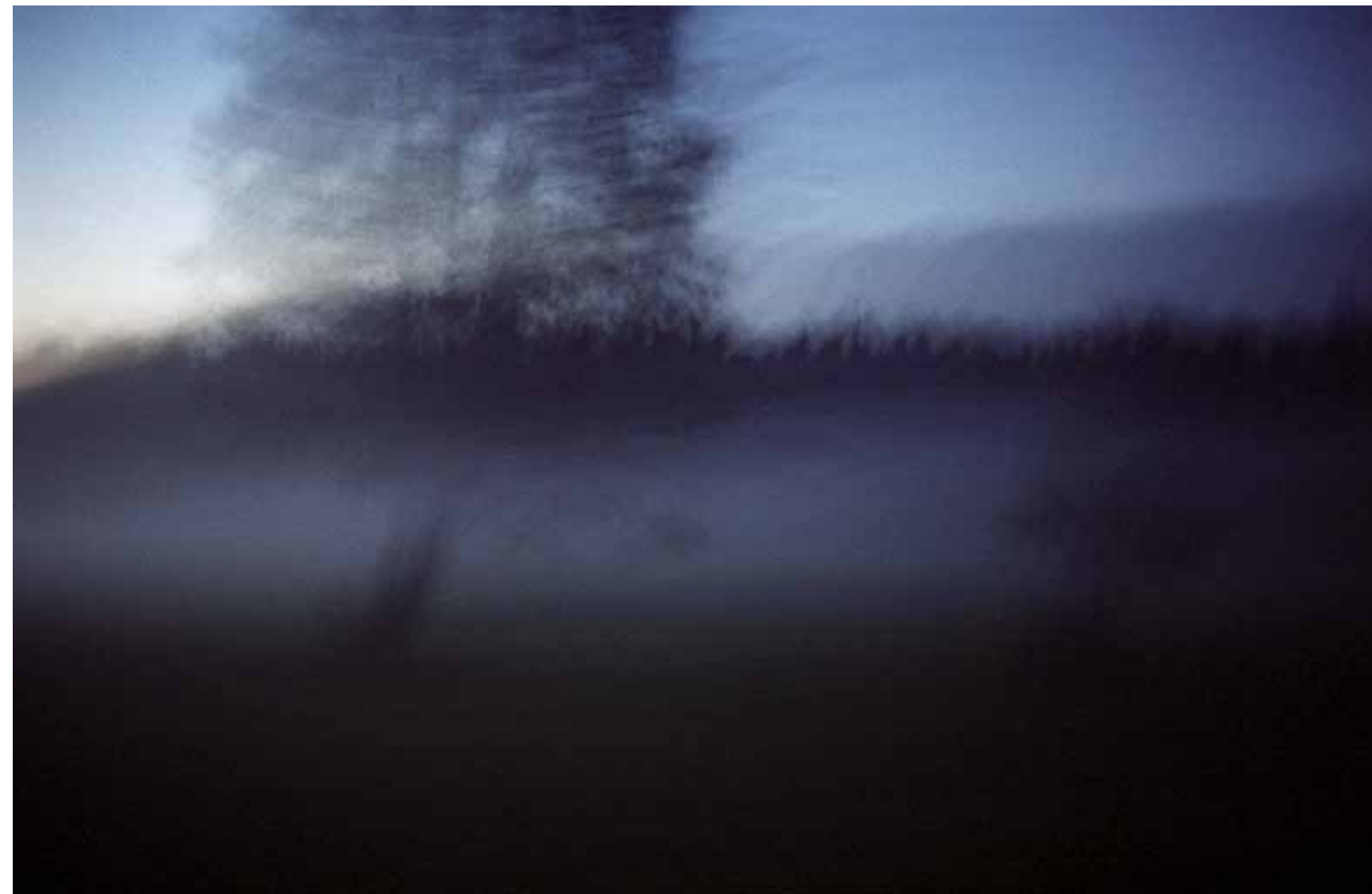
Z cyklu Pejzaże dynamiczne: Pejzaż 05, 2005