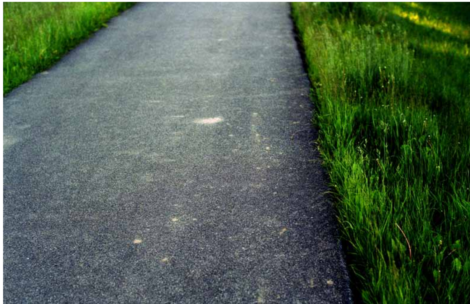
Z cyklu Droga: 46, 2010