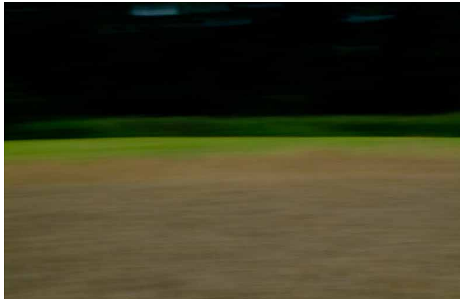
Z cyklu Pejzaże dynamiczne: Pejzaż 117, 2008