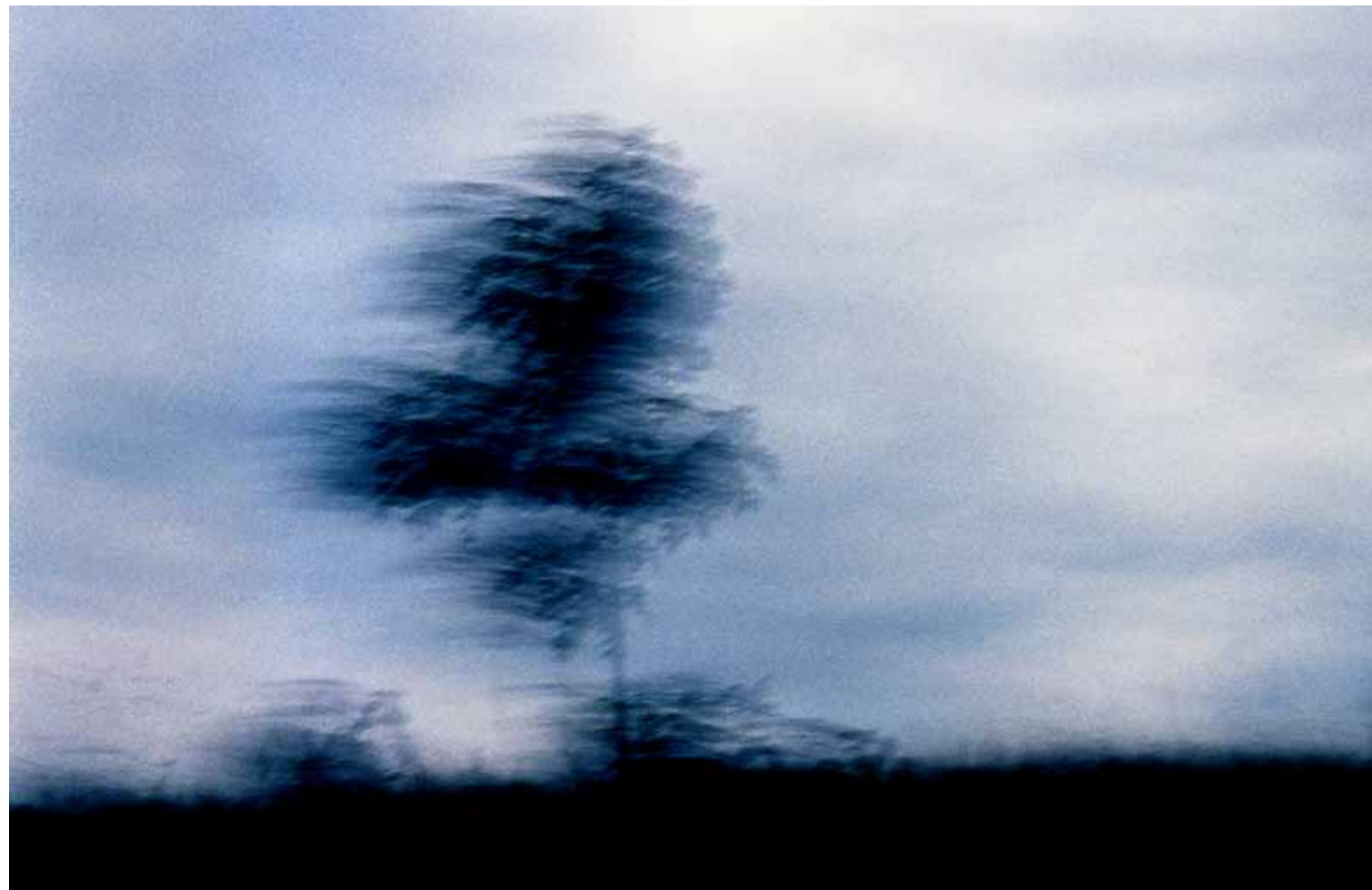
Z cyklu Pejzaże dynamiczne: Pejzaż 17, 2006