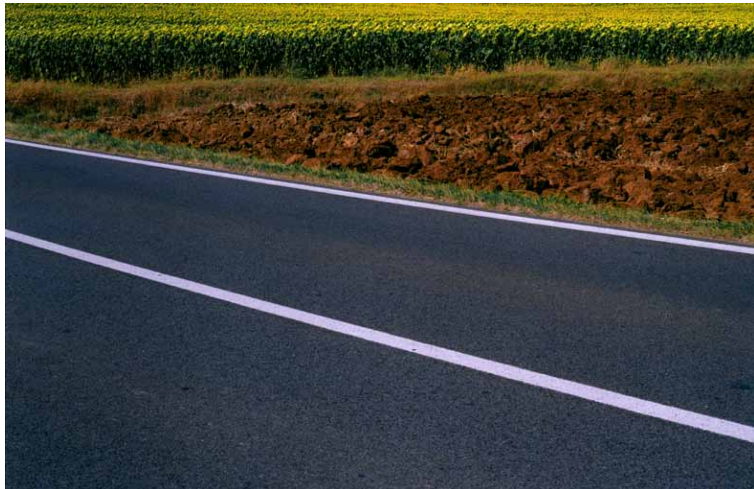
Z cyklu Droga: 16, 2009