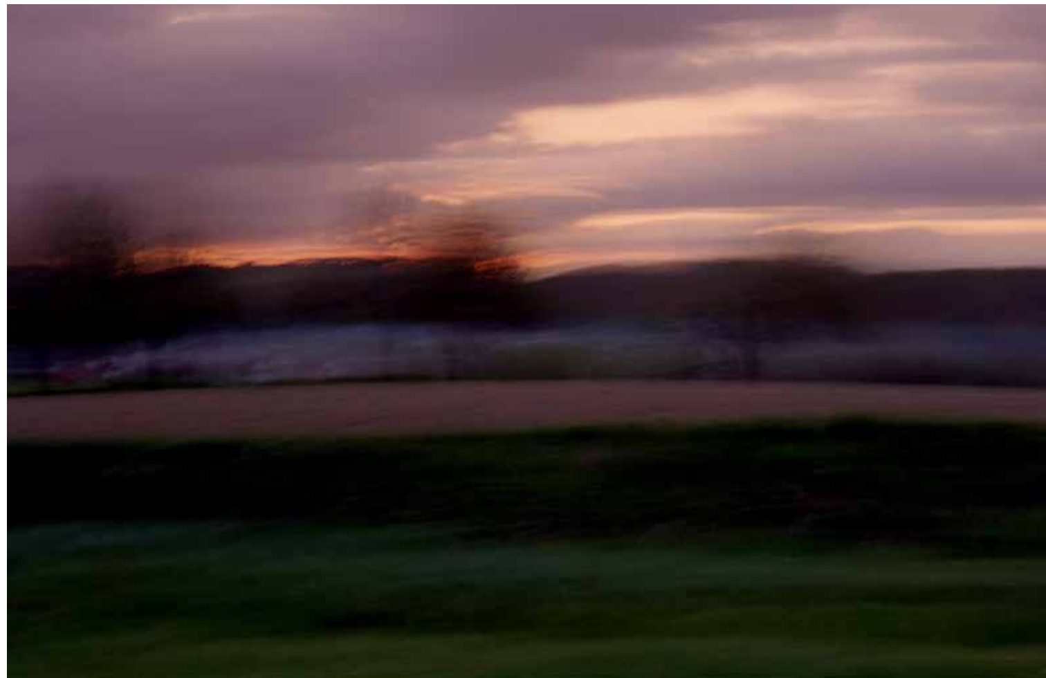
Z cyklu Pejzaże dynamiczne: Pejzaż 25, 2006