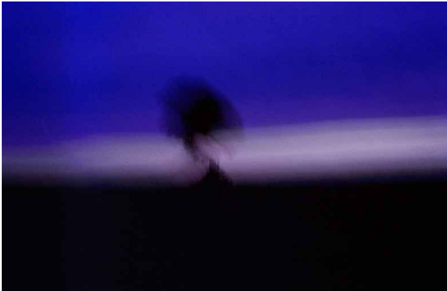
Z cyklu Pejzaże dynamiczne: Pejzaż 48, 2007