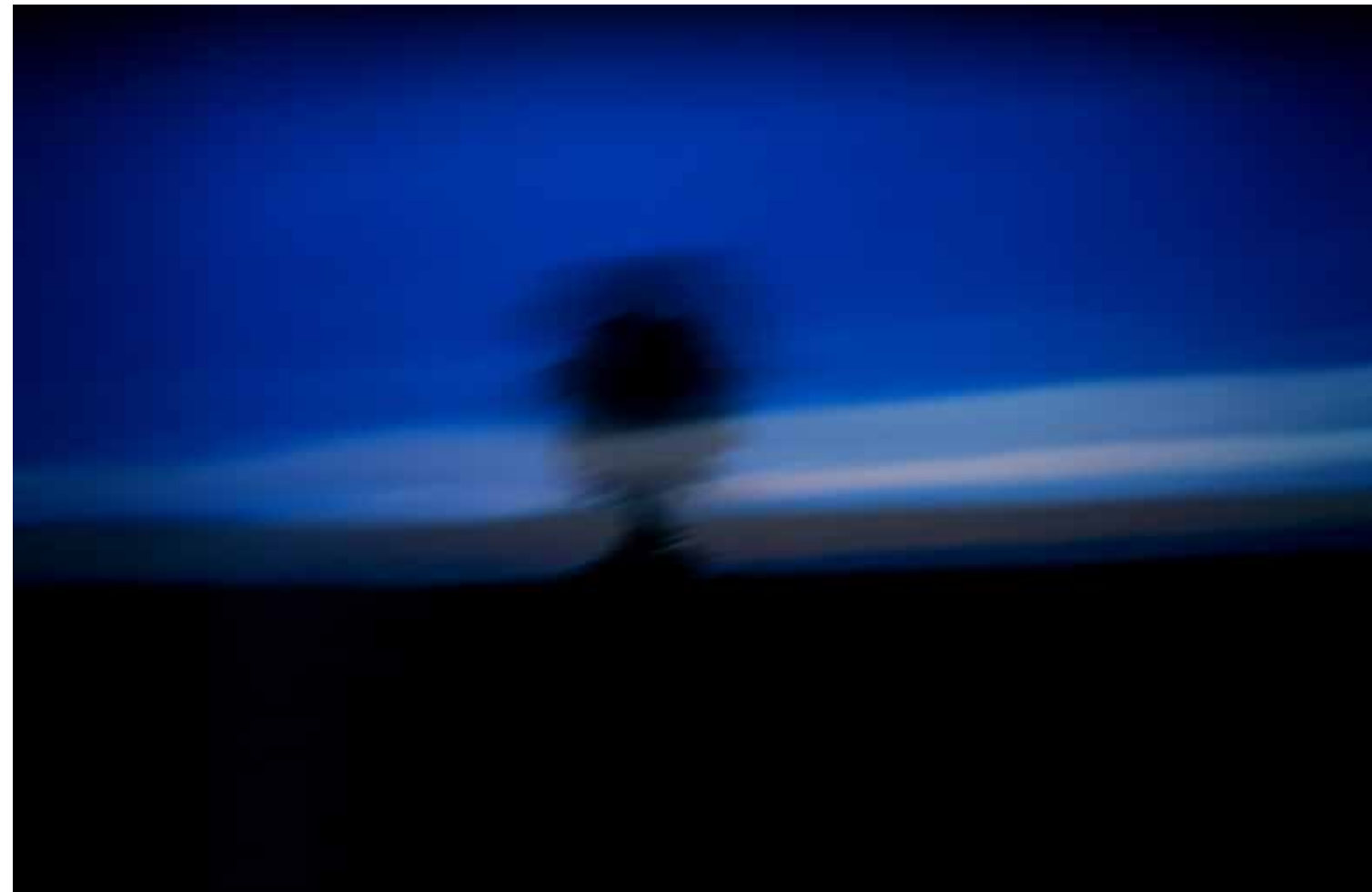
Z cyklu Pejzaże dynamiczne: Pejzaż 47, 2007