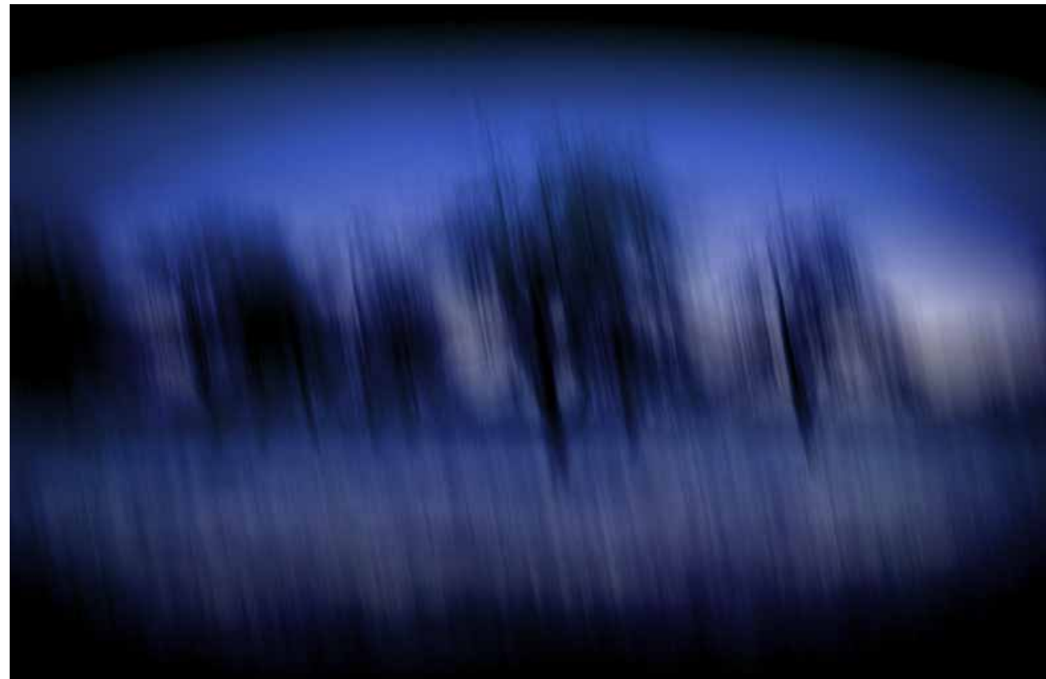
Z cyklu Pejzaże dynamiczne: Pejzaż 73, 2008