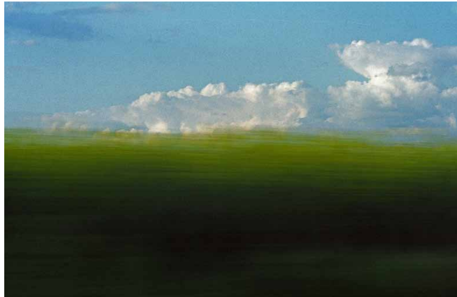
Z cyklu Pejzaże dynamiczne: Pejzaż 123, 2008